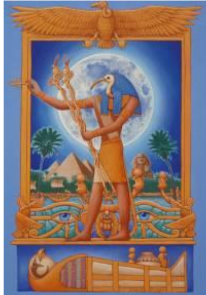
Thoth der Atlanter

Schöpfergott Thoth ist umgeben von vielen Mysterien. Sein Name stammt aus seiner Zeit in Ägypten und ist auch als Thoth, Theuti, Tehut, Theut, Thawth, Theot, Dehuti , bekannt. Der Name Thoth stammt nicht aus seiner Zeit in Atlantis, doch wie er selbst behauptet, ist dies sein Name. Thoth wurde vor etwa 52´000 Jahren als eine Elohim Projektion auf die Erde gesandt und im Experiment Atlantis als Mensch geboren . Schon früh in seinen ersten Lebensjahren wurde er sich selbst bewusst und erkannte seine Herkunft und die Gesetzmäßigkeiten des Universums. Mit seinem Bewusstwerden in seiner ersten Inkarnation stieg Thoth aus der Polarität in die perfekte Balance zwischen