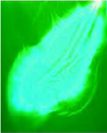
Healthy cells - no sound

So reagieren deine Zellen auf Energie in diesem Bsp. auf Klang: