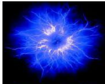
Cotton with prayer. Photo 116