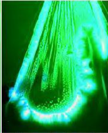
Healthy cells - with sound