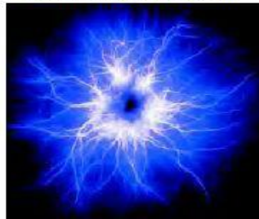
Baumwolle mit Gebet + Sound