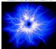
BAUMWOLLE MIT GEBET + SOUND

© Copyright 2009 Britta C. Lambert – Diese Schrift ist nur für den persönlichen Gebrauch des Käufers. Vervielfältigungen jedweder Art – auch elektronisch – sind strikt untersagt. Zur Bestellung einer persönlichen Kopie schauen Sie auf www.die-Seelen-Schamanin.com